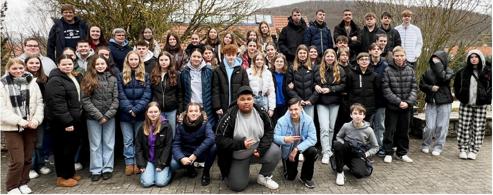
Konfirmandengruppe Vellmar in Uder.

Was würdest du empfinden, wenn du aus deinem Land fliehen müsstest und was würdest du mitnehmen? Eine Frage, die nicht so einfach zu beantworten ist.